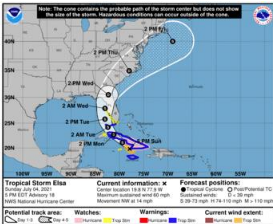
Figura 2. Cono de la posible trayectoria de la tormenta tropical Elsa para los siguientes días.

NHC-National Hurricane Center 4 de julio de 2021. Hora 15:34 HLC.